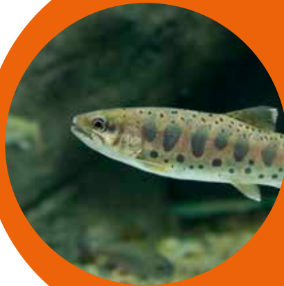
Fisk er det vanligste forsøksdyret i Norge.