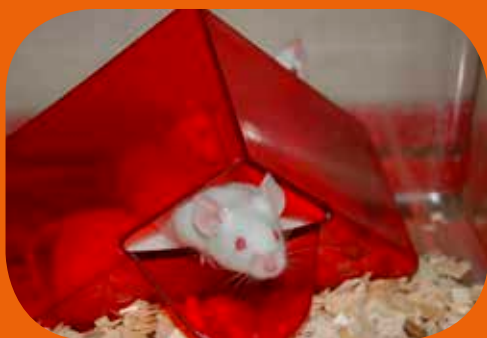
Mus og rotter er vanlige forsøksdyr. De får god omsorg og pleie.