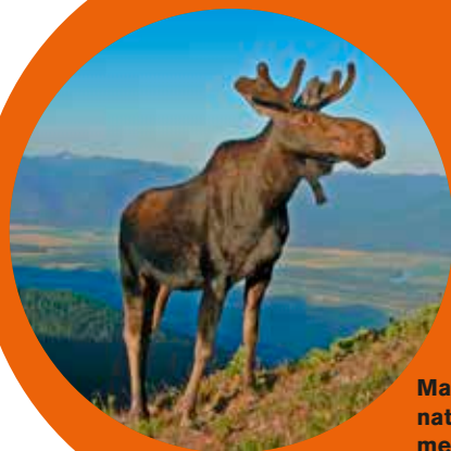
Mange forsøksdyr lever ute i naturen. Elg er blant dyr som merkes med radiosendere.