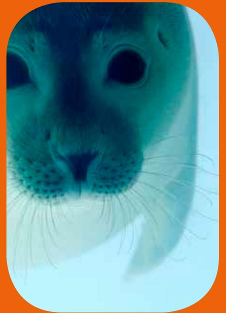
Selen er et annet dyr som følges med radiosendere.