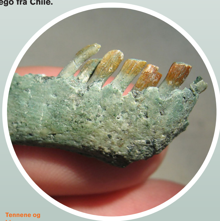
Tennene og kjevane passar ikkje til å ete kjøtt.