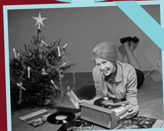
PLATELYKKE: I dag ønsker mange seg mobiltelefon, øyreproppar eller andre elektroniske ting til jul. Ein eigen platespelar stod på ønskelista i 1962.