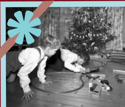
VELSTAND: Disse gutane fekk nok det dei ønskte seg denne jula i 1957 – ein togbane.