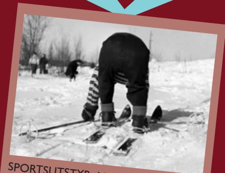
SPORTSUTSTYR: Nye ski til jul var stor stas i 1955, og er framleis ei vanleg gåve.