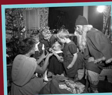
SJOKOLADE: Gåver vi kan ete, har lange tradisjonar. Her får den minste i familien ein sjokoladenisse – mens nissen sjølv ser på.

I Noreg i dag er det også mange som ikkje feirar typisk norsk jul i det heile. Dei har ofte andre feiringar, som den muslimske høgtida id. ●