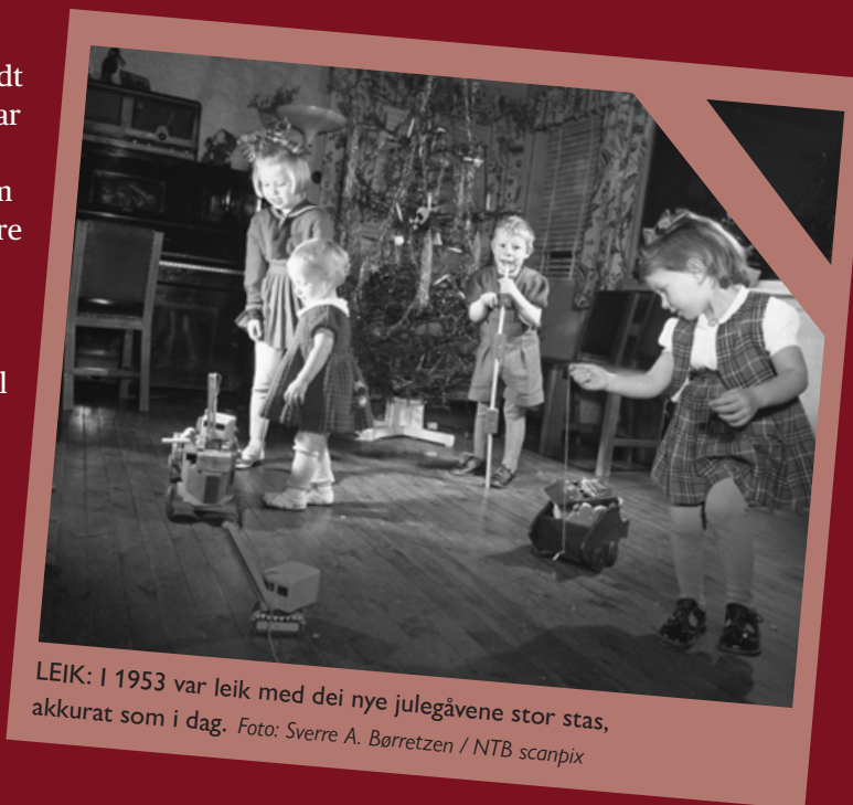
LEIK: I 1953 var leik med dei nye julegåvene stor stas, akkurat som i dag.

– Det var vanleg at alle i familien fekk nokre nye klesplagg, og kanskje også sko. Dette var ting ein uansett trengde. Og tenestejenta på garden fekk kanskje ein ny kjole til jul, men dette var ofte ein avtalt del av lønna, fortel Ann Helene.