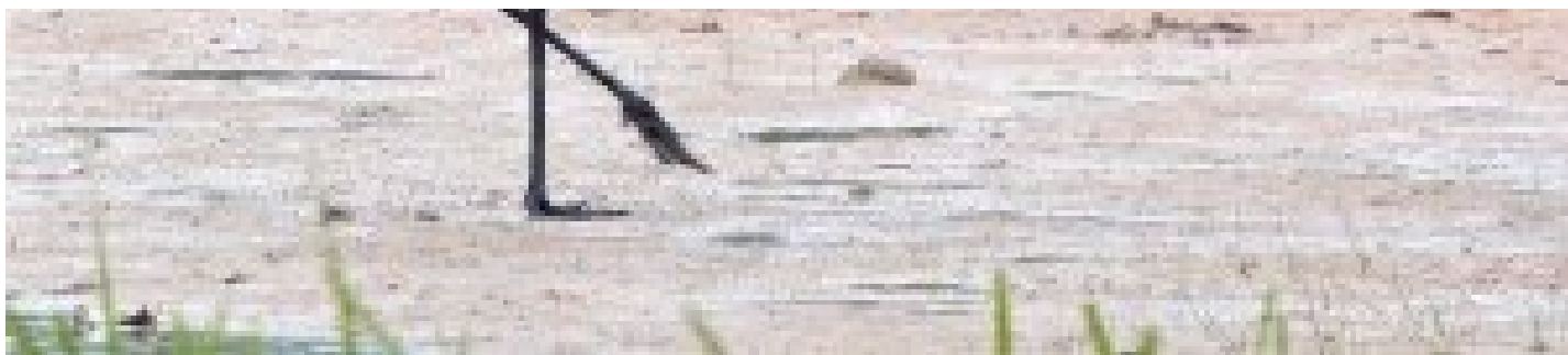
Slik ser en trane ut. Denne er fotografert i Tyskland.