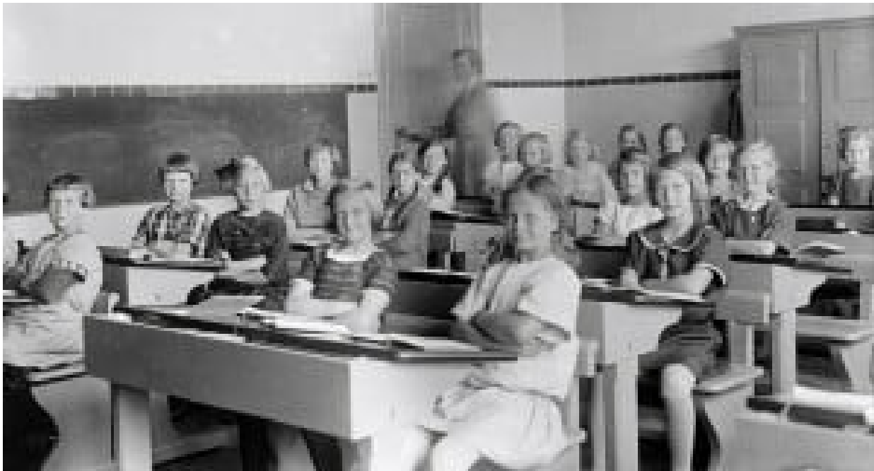
7. klasse ved Vaterland skole i Oslo i 1926.

I Oslo byarkiv finner man hylle på hylle med gamle bøker og papirer. Her kan man finne ut mye rart, blant annet hvordan elever ble straffet i gamle dager. For hundre år siden skrev man nemlig ned i en bok hver gang en elev ble straffet med spanskrør eller bjørkeris. Boken ble kalt straffeprotokoll. Her kan man for eksempel lese at lille Johan ved Bolteløkka skole den 14. mars 1907 fikk fem slag ris for "dovenskap, trass og ulydighet".