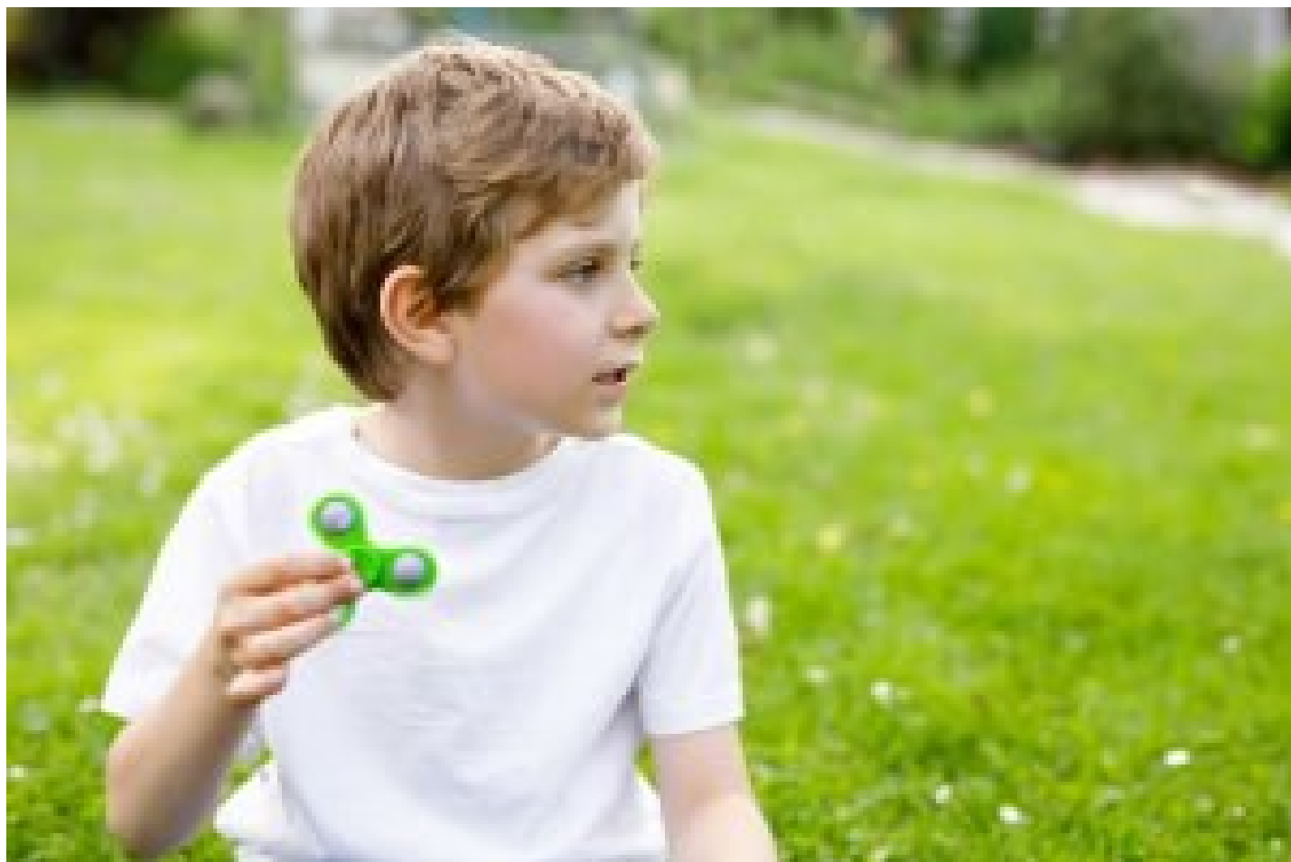
Fikling kan være bra.

Er du en slik som trækker takta, fikler med blyanten og vrir hendene? Det kan gi deg et lengre liv enn hvis du sitter stille i mange timer om dagen.